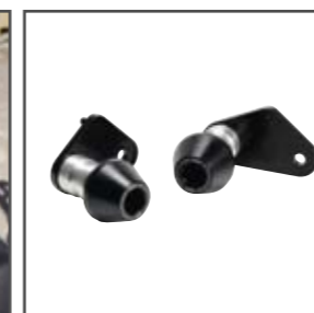
XJ6 S Roulettes