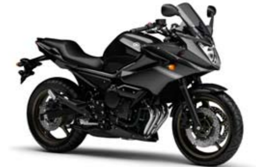
Midnight Black (SMX)