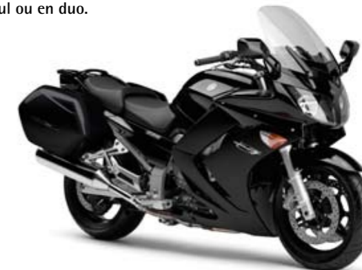
Midnight Black (SMX)