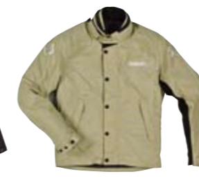
Blouson Street beige