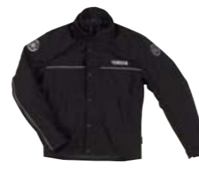
Blouson Street noir