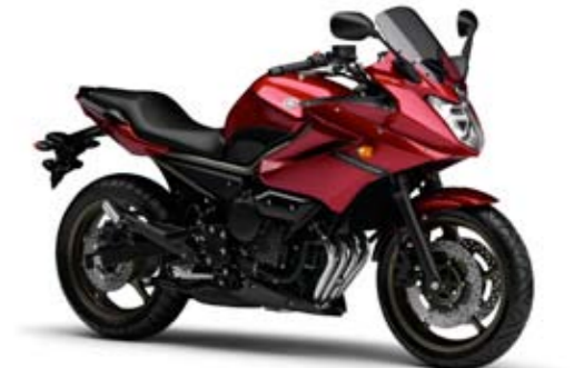
Lava Red (DRMK)