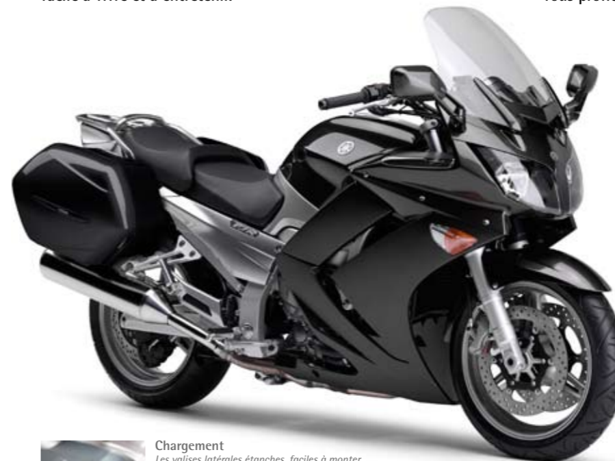
Smokey Grey (DNMA)

Sur route, vous apprécierez les équipements dont bénéficie d'origine la machine et chaque sortie, chaque voyage au guidon de la FJR sera pour vous l'occasion d'apprécier son tempérament sportif et sa puissance fabuleuse, tout autant que son haut niveau de confort et de luxe dont vous profiterez seul ou en duo.