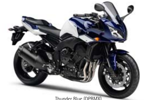
Thunder Blue (DPBMX)