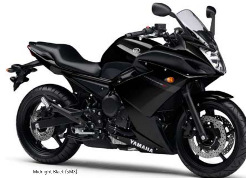
Midnight Black (SMX)

Ses vives accélérations, ses performances et son couple élevé, donnent toute satisfaction, aussi bien sur les parcours urbains que sur longue distance, au quotidien comme lors des escapades du week-end.