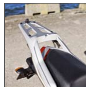
XJ6 S Porte-paquet