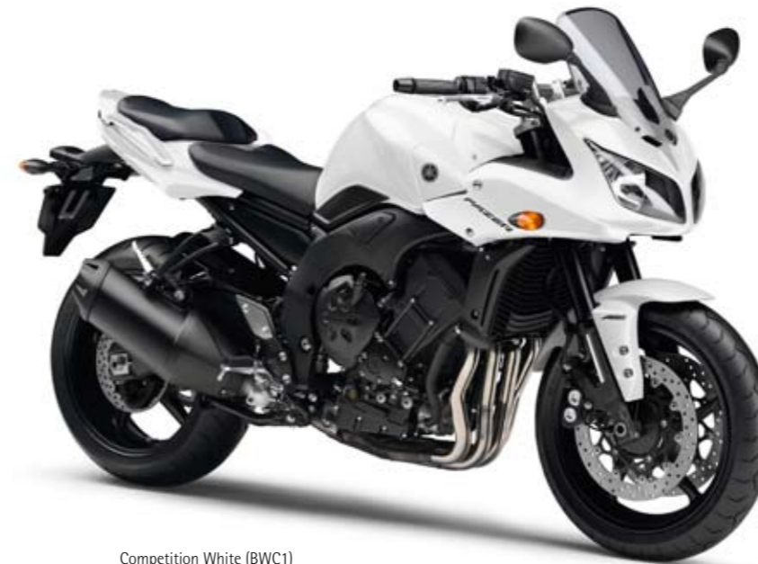
Competition White (BWC1)

à la tenue de route impressionnante et son semi carénage aérodynamique protecteur. L'essentiel dont vous avez besoin tous les jours. La Fazer montre un égal brio à se faufiler dans les bouchons, à avaler les kilomètres d'autoroute ou à enrouler en duo les épingles de montagne. FZ1 Fazer : toujours une longueur d'avance, à tous points de vue.