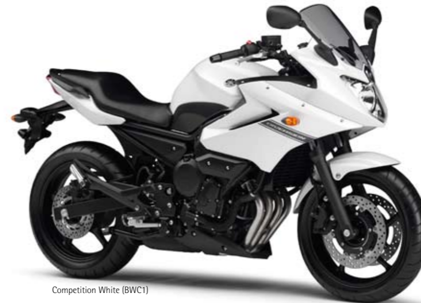
Competition White (BWC1)

acier permet d'inscrire sagement la moto en courbe et le semi-carénage aérodynamique apporte un réel confort, en particulier lors des longs trajets. Et bien sûr, la Diversion profite de la qualité de construction qui a fait la réputation de Yamaha, pour qu'elle vous accompagne pendant de longues années sans souci.