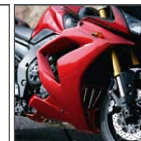
FZ1 FAZER Bas de carénage