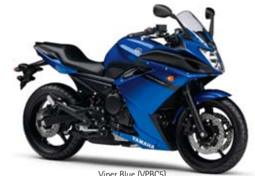
Viper Blue (VPBC5)