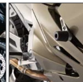
FJR 1300 Déflecteurs de pieds et roulette de protection