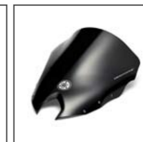
XJ6 F Bulle haute