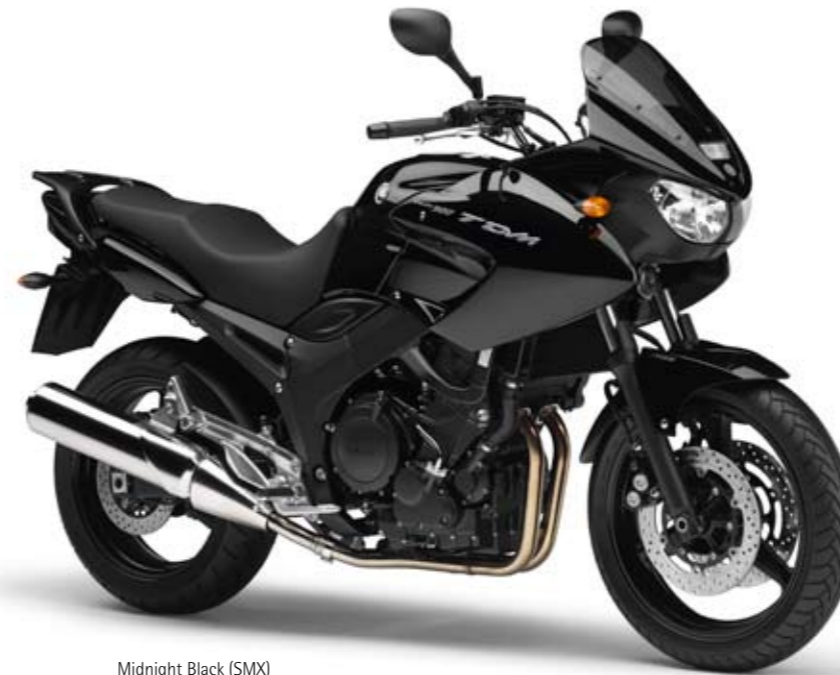
Midnight Black (SMX)

pour le pilote comme pour le passager. Rien d'étonnant, donc, à ce que cette machine pragmatique qu'est la TDM ait conquis des milliers de motards à travers le globe.