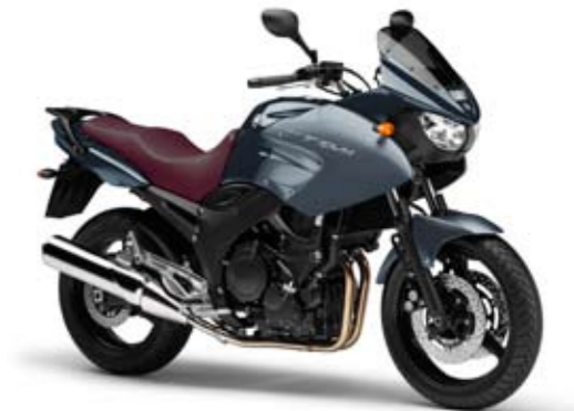
Gun Metallic (MNM1)