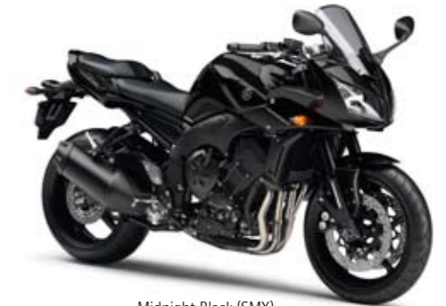
Midnight Black (SMX)